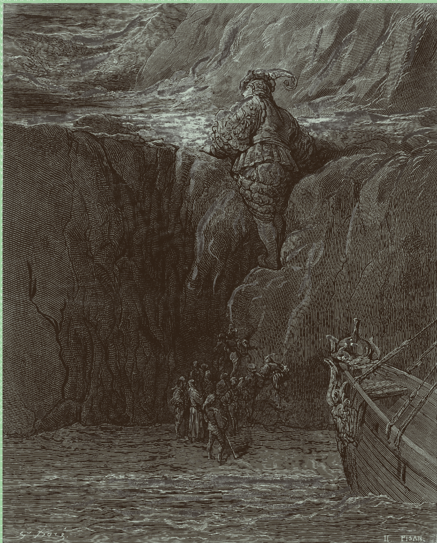
Pantagruel escalade la falaise de l'île gouvernée par messire Gaster, illustration de Gustave Doré pour les Œuvres de Rabelais, tome 2 (1873). Gravure par Héliodore Pisan