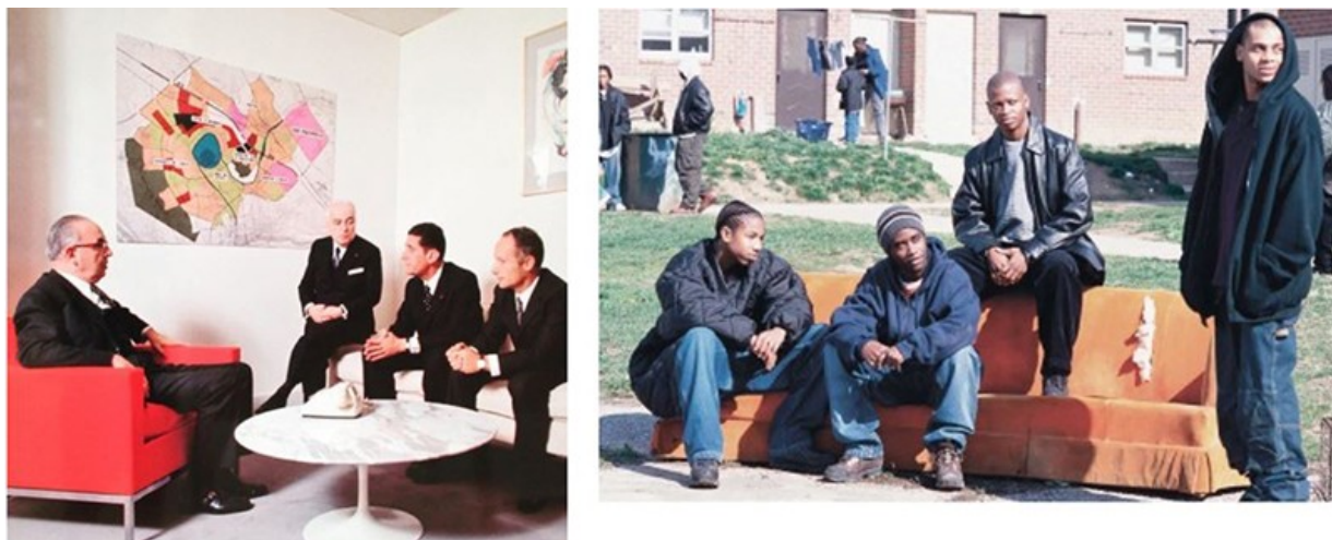
Figure 1. La culture de la planification vs la culture scénaristique : les acteurs de l'aménagement de Cergy-Pontoise (à gauche) et les acteurs de la première saison de The Wire (à droite)

La série The Wire ( Sur écoute en France), créée par David Simon et Ed Burns et diffusée sur la chaîne HBO de 2002 à 2008, illustre la correspondance entre une ambition de projet extrêmement forte et la souplesse autorisée par la structure sérielle. Superposant au sein d'une même saison les unités de temps, de lieu et d'action, The Wire s'attaque à la complexité urbaine et sociologique de la grande ville américaine, en livrant des regards focalisés et circonscrits à des thématiques déterminées. Par le changement de milieu à chaque saison, le remplacement de certains des personnages, acteurs, décors et scénaristes permet à la production une forme d'indépendance vis-à-vis de certains aléas (audience, casting, financements, actualités, etc.) et produit un système en mesure de perdurer. Autour de la figure du showrunner , le scénariste en chef garant de la continuité et de l'unité de la narration, un pool de scénaristes se renouvelle constamment, faisant intervenir des sociologues et des spécialistes des univers abordés par l'intrigue. Le fonctionnement scénaristique devient un système inclusif et ouvert, permettant une écriture à plusieurs mains et l'intervention temporaire de personnalités extérieures.