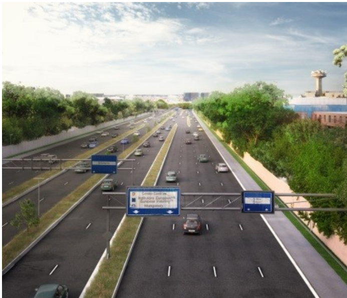
Figure 3. La « saison 0 »

Telle une peinture hyperréaliste, représenter le présent et la situation initiale du territoire de projet par l'image de synthèse généralement réservée à la représentation du futur. Ici la transformation de l'autoroute E40 à Bruxelles par TVK, 2016.